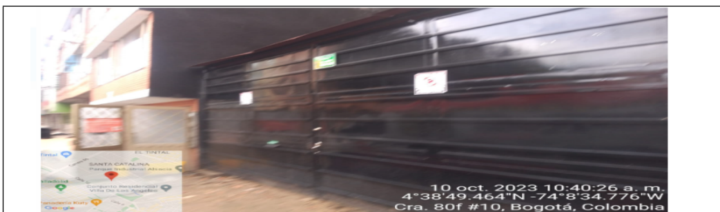
Imagen N°3. octubre 2023, estado del predio con CHIP catastral AAA0148KRTO.