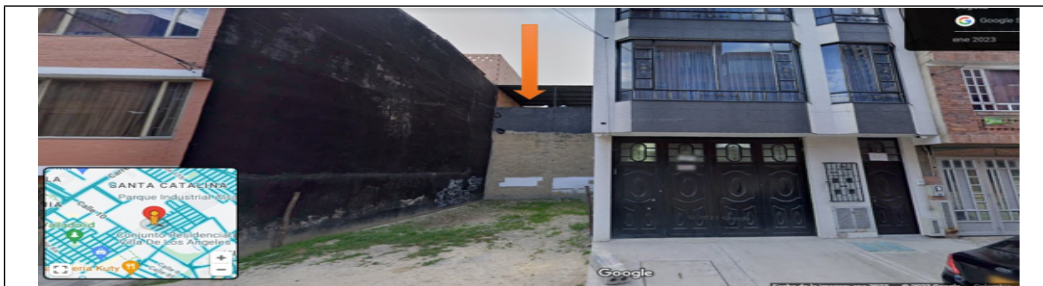
Imagen N°1. enero 2023, estado inicial del predio con CHIP catastral AAA0148KRTO.