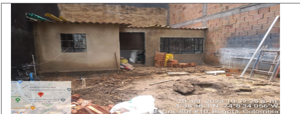
Imagen N°2. octubre 2023, estado del predio con CHIP catastral AAA0148KRTO.